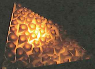
2014年大賞作品「折(おり)」作者:和(拓殖大学)